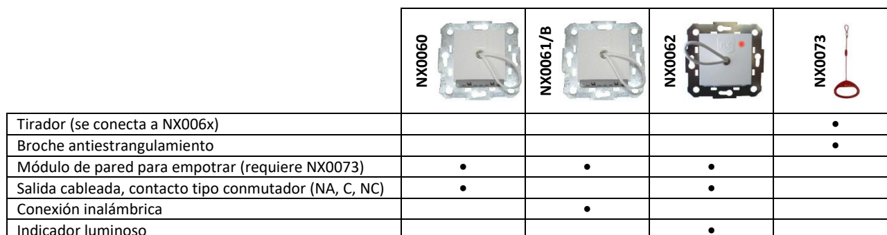
Tabla de Selección